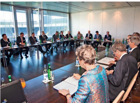
Gemeinsame Arbeit an der Verwaltungsratssitzung in der Sky Lounge.