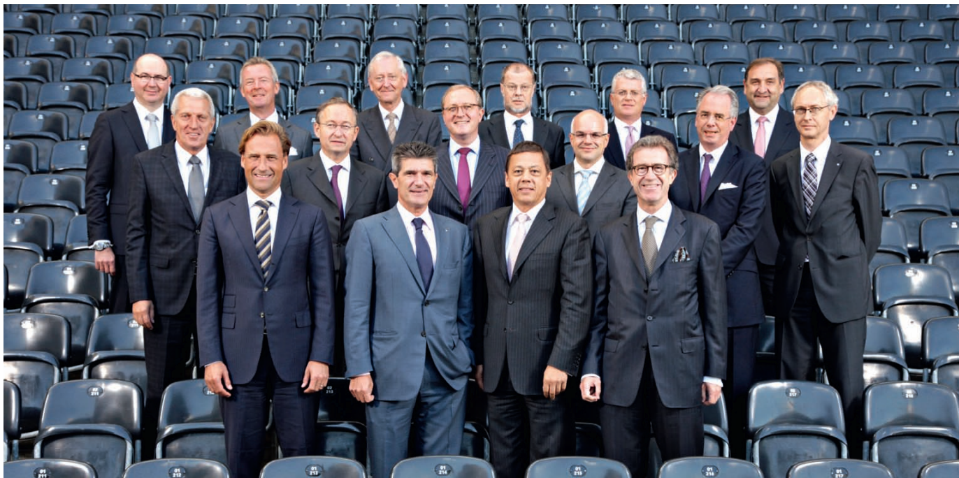
The 16 Swiss Bankers Association board members stood shoulder to shoulder for the group photograph.