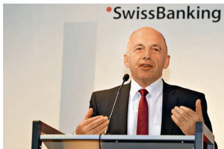
Bundesrat Ueli Maurer warnte vor Fremdbestimmung.

Hier gerät ein völlig unbeteiligter Geschäftsmann, Alfredo Traps, in eine unangenehme Lage. Durch eine Autopanne an der Weiterreise gehindert, sucht er eine Übernachtungsmöglichkeit, die er in der Villa eines pensionierten Juristen findet. Dieser hat gerade ein paar alte Berufskollegen zu Gast, die aus Spass regelmässig Prozesse inszenieren. Für Traps wird das Spiel zum Ernst, als die Juristen ihn – objektiv gesehen völlig haltlos – wegen Mordes unter Anklage stellen. Traps unterwirft sich diesen Anschuldigungen und bringt sich später im Zimmer um.