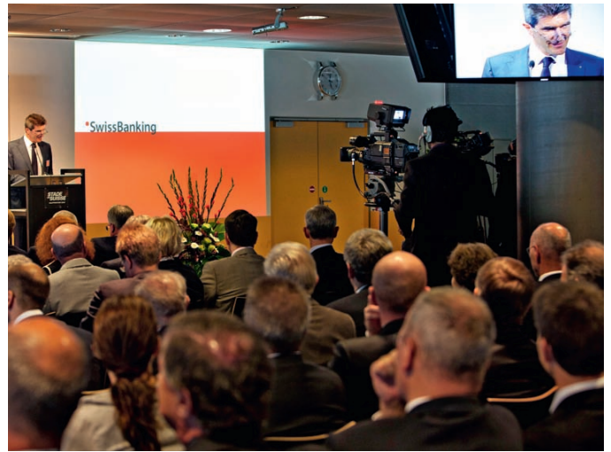
Alle Augen und Kameras sind auf den Präsidenten der Bankiervereinigung gerichtet.