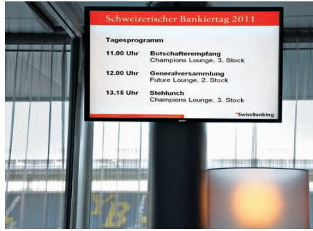
Lounge im Stade de Suisse mit Blick aufs Spielfeld.