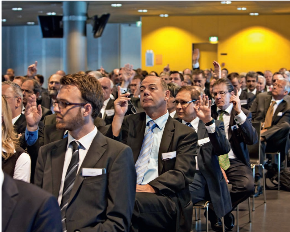
Die Mitglieder unterstützen die gestellten Anträge an der Generalversammlung.