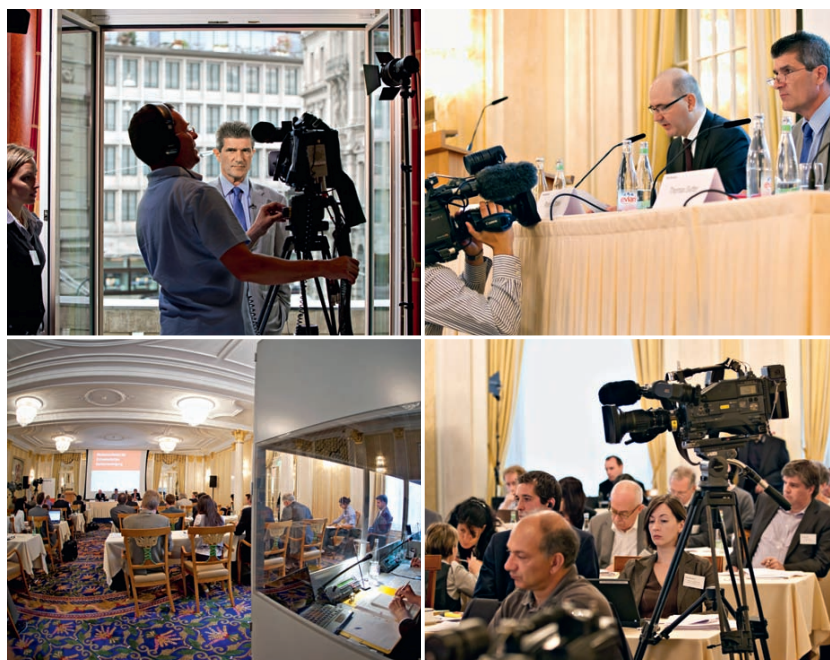
Reges Interesse während der Medienkonferenz direkt neben dem Paradeplatz.

Il est grand temps de prendre le taureau par les cornes et de tout mettre en œuvre pour préserver l'emploi bancaire dans notre pays!