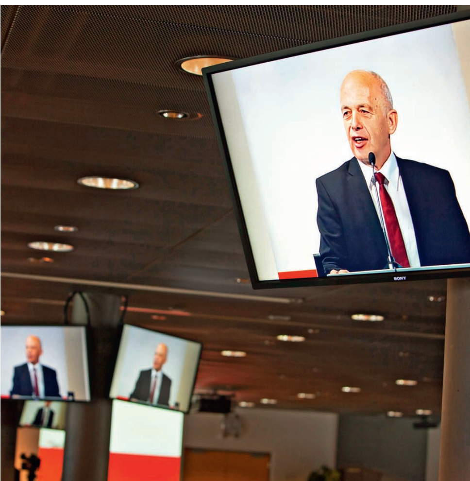
Bundesrat Ueli Maurer als omnipräsenter Redner während der Generalversammlung.