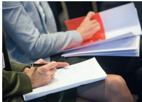
Aufmerksame Zuhörerschaft während den Redebeiträgen.